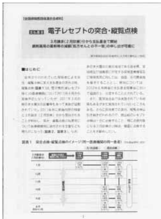
上は24年4月改定の新点数検討会で医科歯科とも各会場で配布の保団連資料冊子(東京保険医協会の診療研究4月号より抜き刷りのB5の12p冊子)在庫あり 請求は長野協会へ

が多く、それを再診のみで引き延ばしているととられているらしいが、とんでもない。口腔外科を知らない審査員の誤解である。口腔外科専門医指導医の方には加点をしてもらいたい」との訴えもあった。