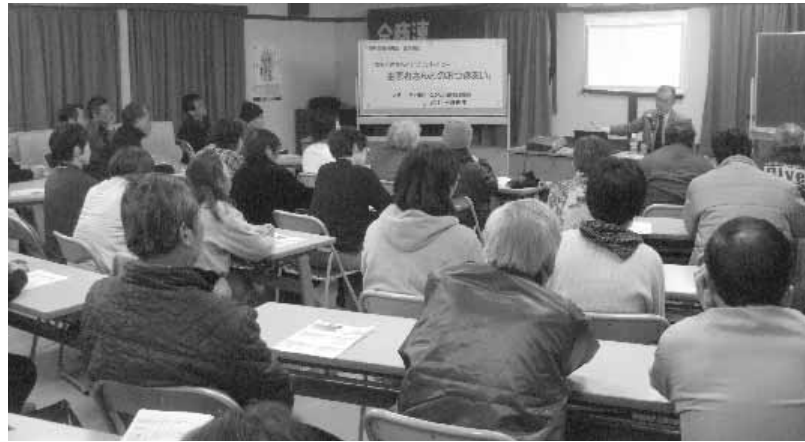
団体内での歯ブラシ配布を契機に歯について学びたいとの機運となりこの会がもたれた

「保険でより良い歯科医療を」長野連絡会では、こうした出前講座を連絡会を構成する一般の団体等に呼びかけている。連絡会事務局を県保険医協会