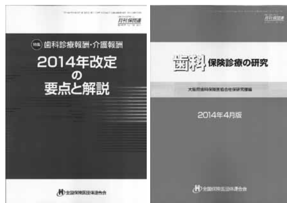
A4サイズで発行の歯科の新点数関係書籍2冊

新点数検討会を実施してきました。また「歯科保険診療の研究2014年」は連休前の4月下旬に歯科開業医会員に一斉配布の段取りです。同書籍は勤務医会員には会員価格で販売の扱いとなっており、別途同書籍の案内も予定しています。